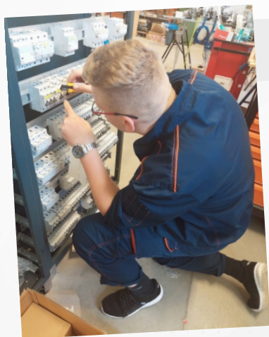
Stručna praksa iz područja industrijskih instalacija i automatizacije u poduzeću ZAE Sp. z o.o.