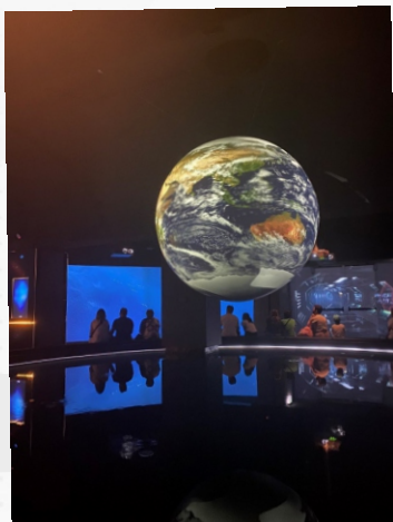
Posjet muzeju Hydropolis