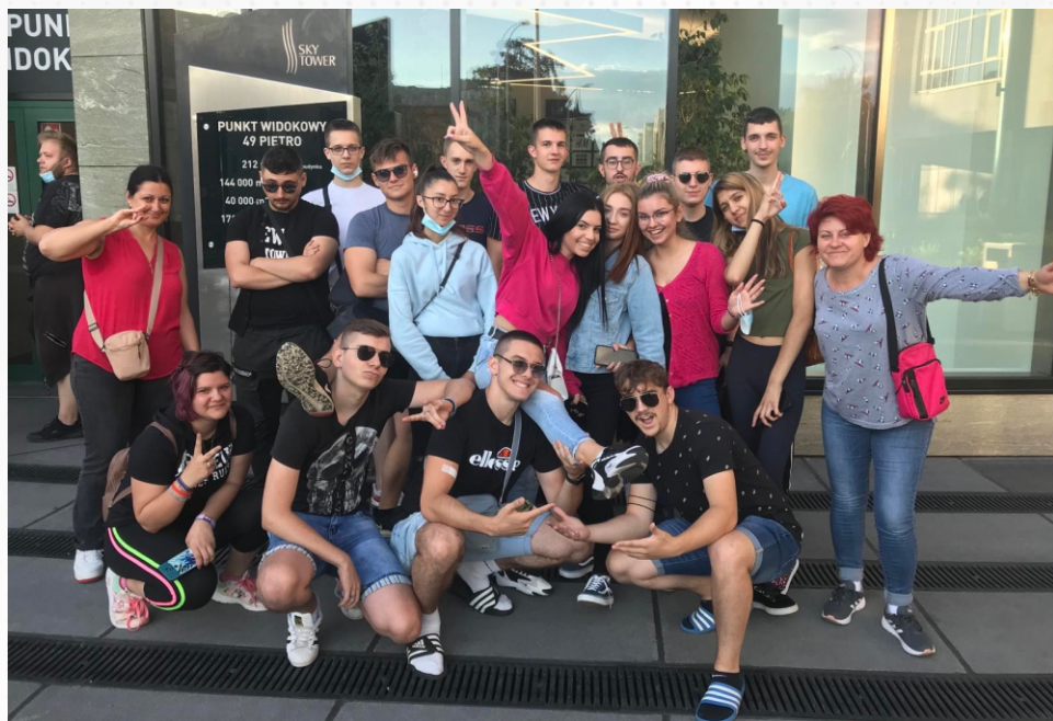
Sudionici mobilnosti u Wrocławu